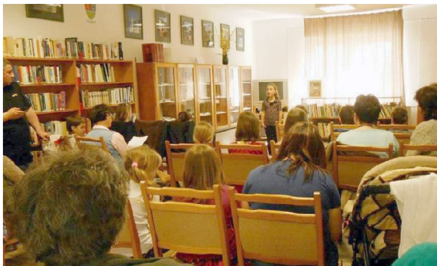
A költészet napja