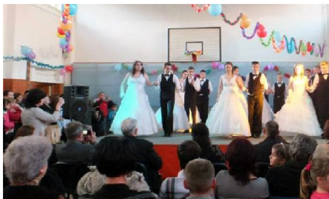
Keringő az iskolai farsangon