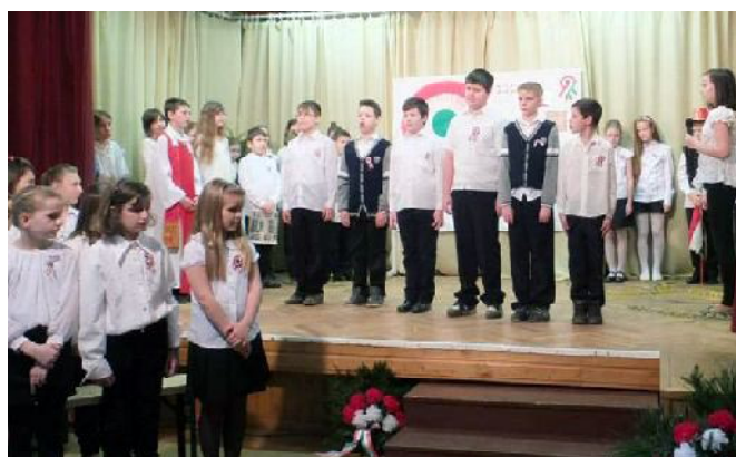
Március 15-i műsoron az 5. osztály és az énekkar