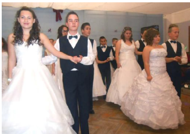
A jótékonyági bálon is felléptek tanulóink.

Az elnyert támogatás összege: 668.000 forint.