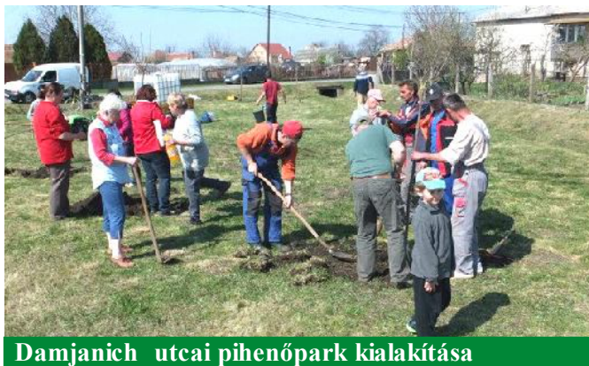
Damjanich utcai pihenőpark kialakítása